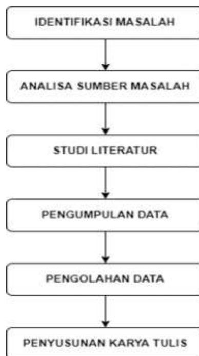
Gambar 1. Diagram Penelitian