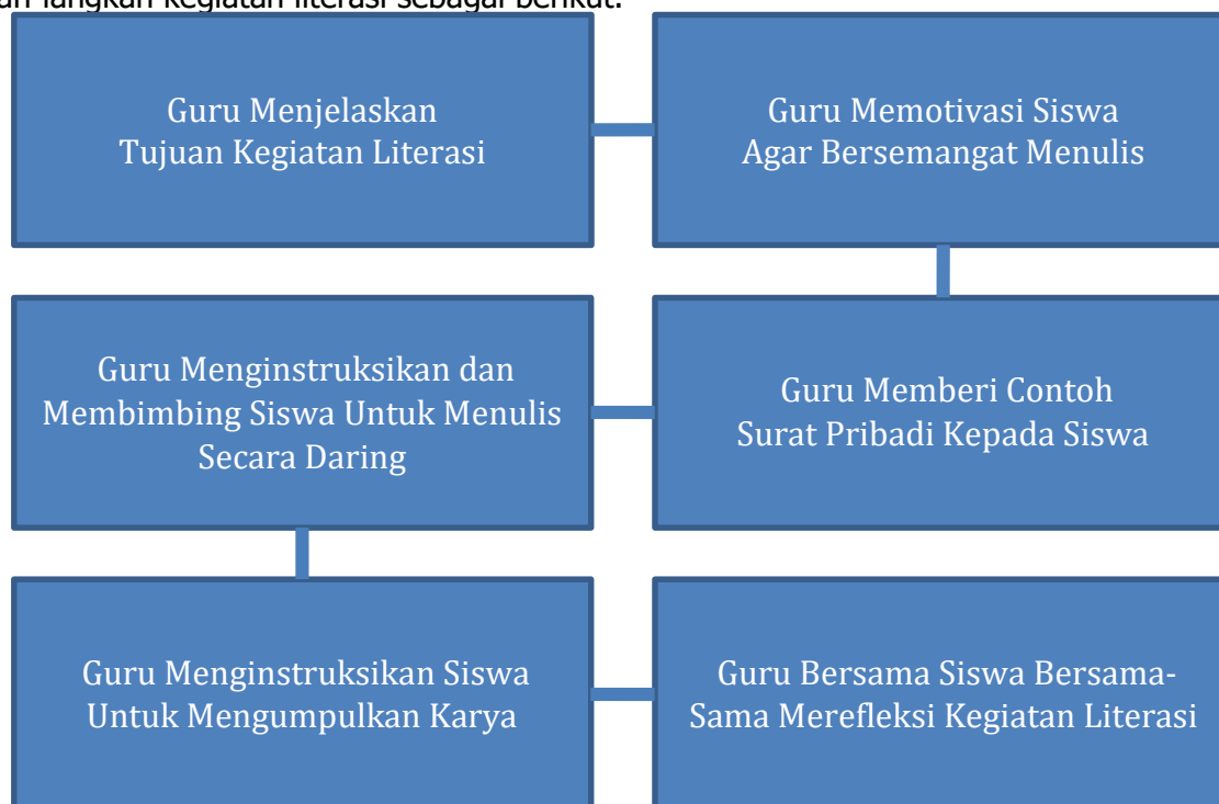
Bagan 2. Langkah-langkah Kegiatan Literasi

Berdasarkan sebelas orang partisipan yang terlibat dalam penelitian ini, terdapat lima orang menulis surat untuk Menteri Pendidikan Indonesia yakni Bapak Nadiem Makarim. Selain itu, ada objek lain yang menjadi tujuan surat yang ditulis oleh sebelas partisipan tersebut, misalnya teman, ibu, ayah, guru, dan saudara di kampung halaman. Menteri Pendidikan Indonesia paling banyak dipilih karena sesuai dengan konteks pendidikan mereka yang berada di area tertinggal. Artinya, peluang menulis surat ini dapat dimanfaatkan oleh partisipan untuk meluahkan isi hatinya dalam surat tersebut. Adapun langkah-langkah kegiatan literasi sebagai berikut.