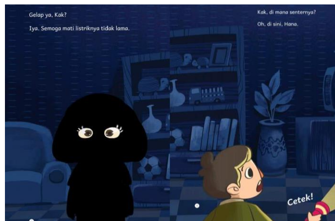
Gambar 1. Teks 1 Hal. 2 – 4 (Noorsari, 2019)

Pada bagian awal cerita terlihat jelas bahwa Rei dan Hana tengah menghadapi proses merasakan dan mengamati adanya masalah di sekitar mereka. Masalah yang dimaksud adalah terjadinya pemadaman listrik di rumah mereka yang mengakibatkan seisi rumah menjadi gelap. Penggalan cerita berikut ini menjadi bukti yang menunjukkan adanya aspek perkembangan kreativitas anak aspek pribadi.