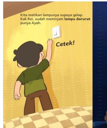
Gambar 4. Teks 1 Hal. 12 (Noorsari, 2019)