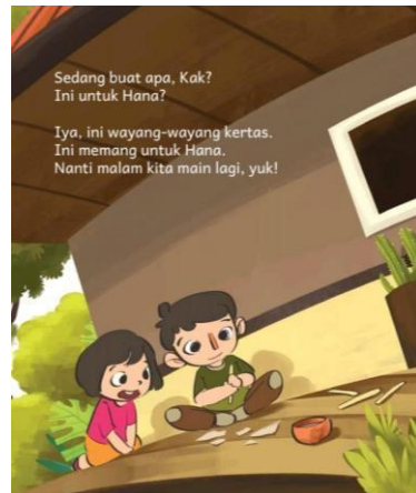
Gambar 3. Teks 1 Hal. 10 (Noorsari, 2019)

kegiatan yang baru bagi mereka tersebut. Aspek tersebut mendorong anak membuat dugaan/hipotesis dari fenomena yang baru mereka temukan, yaitu mengamati bayangan yang tercipta dari senter yang menyala di kegelapan. Hal ini tentu menstimulus daya kreatif yang dimiliki kedua tokoh untuk melakukan kegiatan selanjutnya yang diuraikan berikut ini.