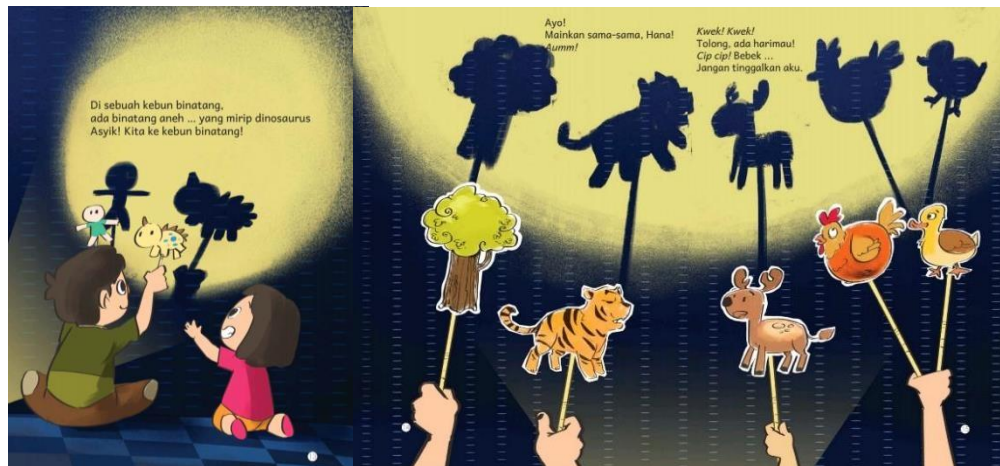
Gambar 4. Teks 2 Hal. 13 – 15 (Noorsari, 2019)

orang dewasa. Adegan tersebut menunjukkan bahwa kedua tokoh terlibat aktif dan mandiri dalam melakukan aktivitas yang baru bagi mereka. Aspek terakhir yang terlihat pada gambar tersebut adalah (4) aspek produk yang berupa berupa model, tindakan, gerakan, kata-kata, melodi, bentuk, atau karya lainnya. Gambar tersebut jelas menunjukkan produktifitas kedua tokoh membuat wayang dari kertas dan menghasilkan produk yang berguna sebagai media bermain bagi keduanya. Produk tersebut lantas mereka gunakan dengan antusias seperti yang tertera pada gambar berikut ini.