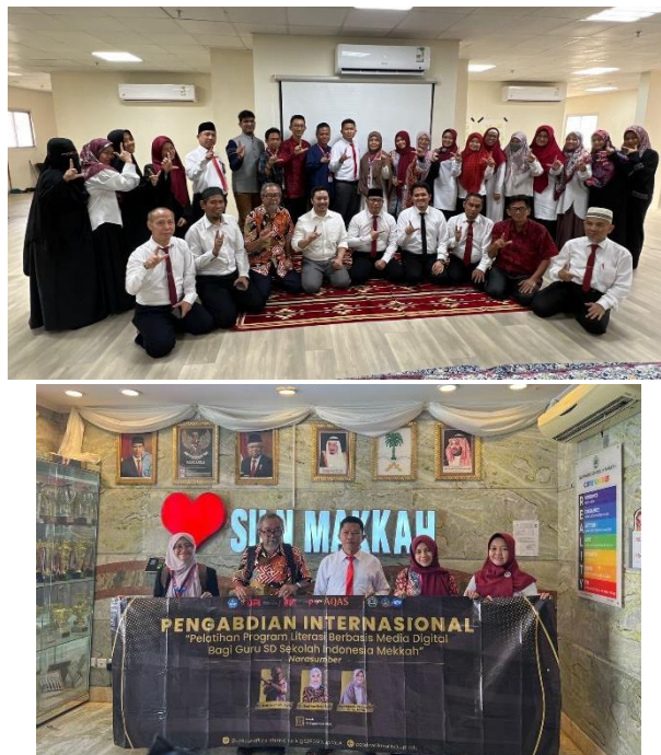
Gambar 2. Dokumentasi Pelaksanaan Pelatihan Program Literasi Berbasis Google Sites

langkah praktis mulai dari pembuatan halaman, penambahan konten literasi, hingga mengelola situs agar sesuai dengan kebutuhan. Kegiatan ini kemudian dilanjutkan dengan pelatihan terbimbing, para guru dipandu secara intensif untuk memastikan mereka tidak hanya memahami teori tetapi juga siap dan percaya diri mengaplikasikan program literasi berbasis media digital di sekolah. Dukungan dan bimbingan yang diberikan bertujuan agar guru dapat menerapkan program literasi secara efektif dan membuat kegiatan literasi lebih interaktif dan menarik bagi peserta didik. Tahap akhir pelatihan meliputi diskusi dan sesi tanya jawab, di mana para guru dapat mengungkapkan pemahaman mereka, bertanya, dan berdiskusi mengenai tantangan dan strategi implementasi program literasi di SD Sekolah Indonesia Makkah.