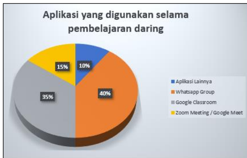
Gambar 1. Aplikasi yang Sering Digunakan Selama Pelaksanaan Kelas Daring

Pertanyaan selanjutnya mengenai persepsi guru selama pelaksanaan kelas daring berlangsung. Keempat informan diminta untuk mengisi kuisioner dengan skala pengukuran likert ( Likert Scale ) dengan data mengenai aplikasi yang digunakan selama pelaksanaan kelas daring yakni sebagian besar informan lebih sering menggunakan aplikasi Whatapp Group sebanyak 40% dan Google Calssroom sebanyak 35%. Namun, informan juga sempat menggunakan aplikasi Video Conferences seperti Zoom Meeting dan Google Meet yakni sebanyak 15%. Sedangkan aplikasi lain yang sempat digunakan seperti Quizizz , Rumah Belajar , dan lain-lain hanya digunakan sebanyak 10% saja. Data lengkapnya dapat dilihat pada Gambar 1.