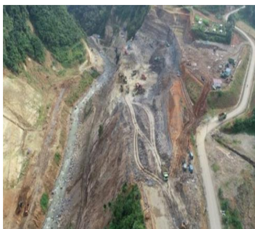
Gambar 1. Tampak atas dari Bendungan Lau Simeme – Deli Serdang

Perubahan iklim saat ini telah menyebabkan peningkatan kejadian hujan ekstrem di Indonesia (IPCC, 2014; Suripin & Kurniani, 2016). Oleh karena itu, perubahan tren curah hujan menjadi faktor penting yang harus dipertimbangkan dalam analisis hidrologi, terutama dalam konteks perencanaan bangunan air (Izzi dkk., 2017; Syarifudin, 2017). Berdasarkan konteks yang telah diuraikan sebelumnya, penelitian ini dilakukan untuk mengidentifikasi periode ulang curah hujan di wilayah sekitar bendungan Lau Simeme. Data curah hujan yang diperoleh akan digunakan untuk menghitung debit aliran sungai dan debit banjir rancangan di bendungan Lau Simeme. Melalui penelitian ini, diharapkan akan diperoleh informasi mengenai kapasitas pelimpah pada bendungan Lau Simeme berdasarkan analisis frekuensi banjir di Daerah Aliran Sungai (DAS) Percut. Hasil penelitian ini diharapkan dapat menjadi landasan bagi para pemangku kepentingan untuk meningkatkan pengelolaan sumber air bendungan Lau Simeme agar lebih optimal.